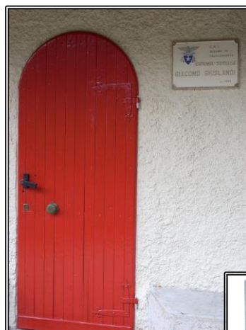
Capanna sociale Giacomo Ghislandi al Passo del Fò 1284 m