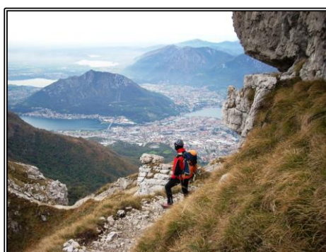
Discesa verso Lecco