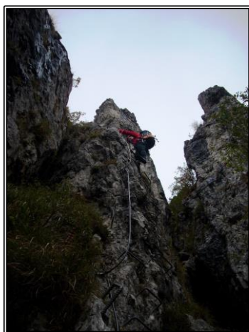
Ferrata del Centenario