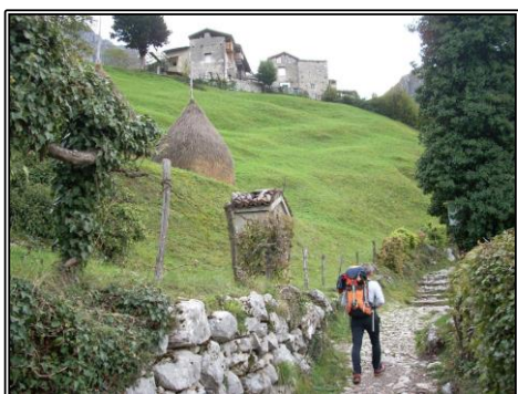
Località Costa 780 m

Dove Prealpi Lombarde In auto Sondrio, Morbegno, Lecco uscita Lecco Centro Parcheggio Piazzale della funivia dei Piani d'Erna in località Malnago via Prealpi 34 Dislivelli Q_{\min} = 610 \text{ m} / Q_{\max} = 1875 \text{ m} / \Delta_s = 1265 \text{ m} Tempi T_s = 4.30 \text{ h ca} Segnaletica Sì Difficoltà EE il sentiero, più parete attrezzata Attrezzatura Scarponi, imbragatura bassa, kit da ferrata e casco omologati, abbigliamento da montagna, guanti e berretta, pranzo al sacco, bevande. Utili i guanti da ferrata.