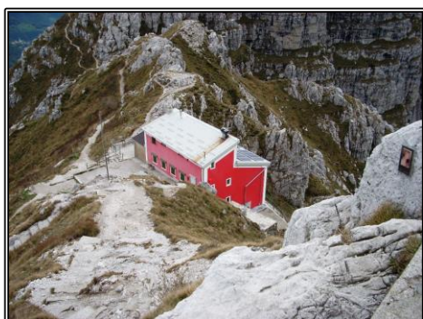
Rifugio Azzoni 1860 m